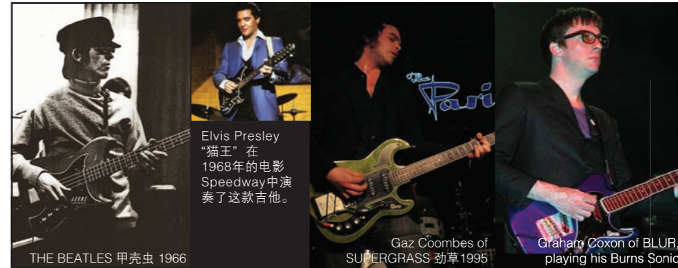
THE BEATLES 甲壳虫 1966